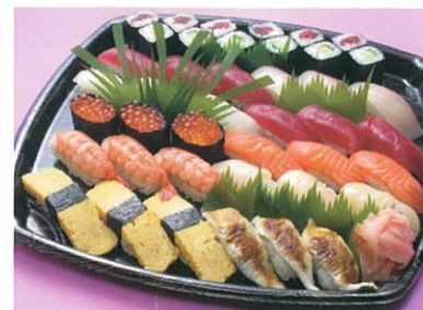
商品番号 1031 にぎり寿司 3,675円