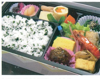
商品番号 1022 駒草(こまくさ) 1,100円