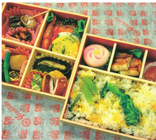
商品番号 1018 越後ろまん 2,300円