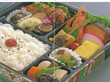
商品番号 1024 水芭蕉(みずばしょう) 1,300円