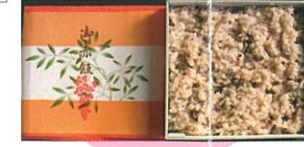
商品番号 1038 お赤飯1kg 2,100円