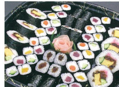
商品番号 1029 巻き寿司セット 3,675円