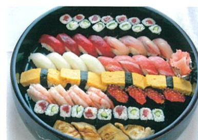
商品番号 1034 にぎり寿司 7,350円