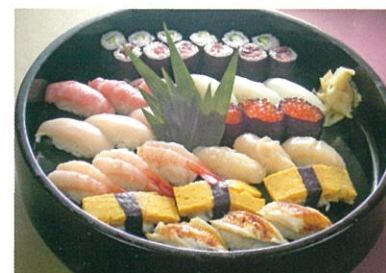
商品番号 1035 にぎり寿司 5,250円