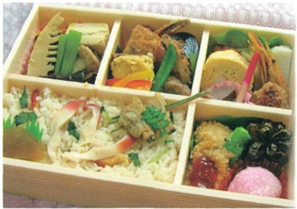
商品番号 1017 旬のお楽しみ御膳 1,650円