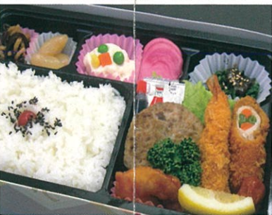
商品番号 1021 菖蒲(あやめ) 880円