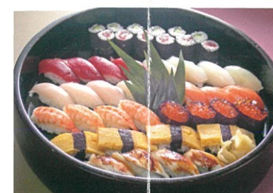
商品番号 1033 にぎり寿司 4,200円