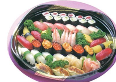
商品番号 1032 にぎり寿司 6,300円