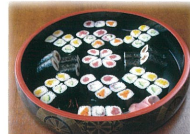
商品番号 1028 巻き寿司 2,625円