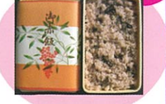
商品番号 1040 お赤飯250g 600円