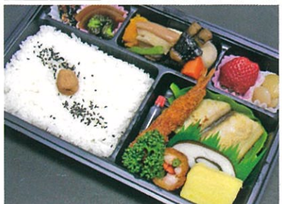
商品番号 1023 花菖蒲(はなしょうぶ) 1,100円