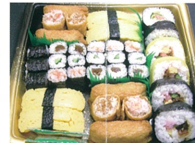
商品番号 1030 巻き寿司盛り合せ 1,800円