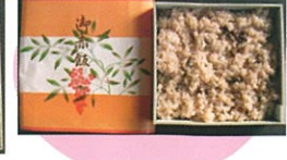
商品番号 1039 お赤飯500g 1,100円