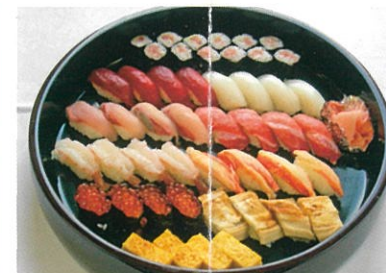
商品番号 1036 にぎり寿司 10,000円