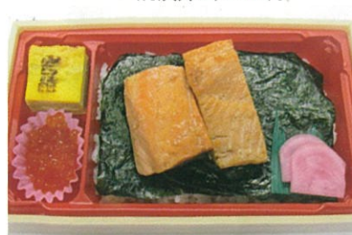
商品番号 1025 新潟県郷土料理 焼漬弁当 870円