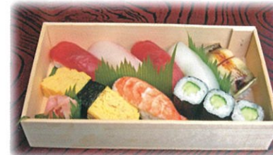
商品番号 1026 竹にぎり 1,575円